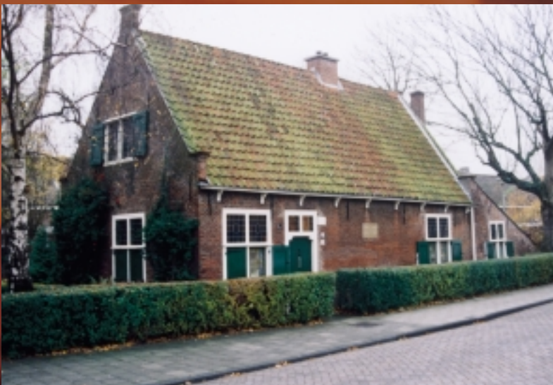
Het Spinozahuisje in Rijnsburg

Spinoza verdiende in Rijnsburg de kost met het slijpen van lenzen voor telescopen en microscopen. Kennelijk beheerste hij de wiskunde die nodig was voor dit precisiewerk. In het stille dorpje vond hij de rust om te werken aan zijn wijsgerige stelsel. Zijn eerste publicatie dateert uit deze periode. Studenten uit Leiden wisten hem te vinden voor privé-lessen in de wijsbegeerte. Een aanbieding om hoogleraar in Heidelberg te worden sloeg hij af, bang om zijn onafhankelijkheid als wetenschapper te verliezen.