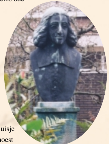
De buste van Baruch de Spinoza