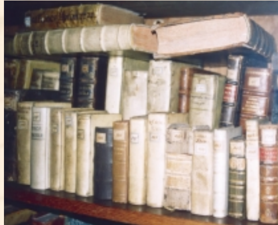
Boeken in de kamer van de filosoof

want gevonden. Beiden waren van joodse afkomst, maar vervreemd van de joodse gemeenschap. Beiden waren ballingen: Spinoza's familie was uit Portugal naar Nederland gevlucht voor de jodenvervolging en Einstein zou om dezelfde reden van Duitsland naar Amerika emigreren. Beiden koesterden hun vrijheid als wetenschapper, hoewel Spinoza voor die vrijheid grotere offers heeft moeten brengen dan Einstein. Hun vakgebieden waren heel verschillend, maar Einstein vond in het strikt deterministische wereldbeeld van Spinoza een rechtvaardiging voor zijn eigen afkeer van de quantummechanica. "God dobbelt niet", schreef hij, verwijzend naar de god van Spinoza.